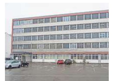
Das Schulprovisorium «Dreier» in der Oberentfelder Industrie überzeugt durch grossen, hellen Schulraum.