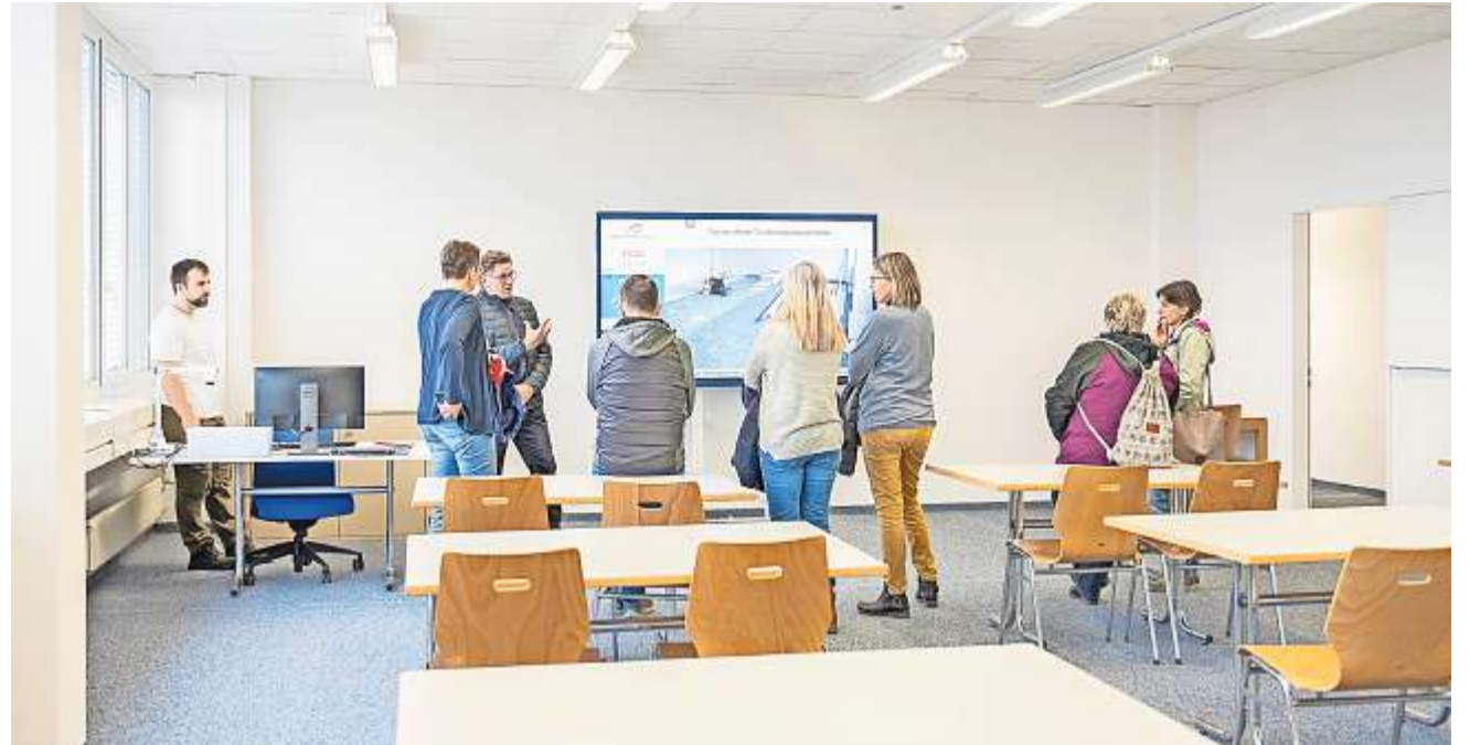
Das Musterzimmer war gut besucht. Hier konnten auch Fragen gestellt werden.