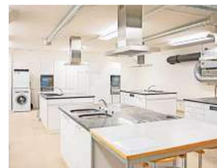
Die moderne Kücheneinrichtung konnte vom blauen Oberstufenschulhaus übernommen werden.

Der Rundgang am Tag der offenen Tür vom 17. Februar führt zunächst ins Untergeschoss des Schulprovisoriums «Dreier» an der Carl-Sprecher-Strasse 3. Im Raum des Fachs Wirtschaft, Arbeit, Haushalt (WAH) konnte bereits eine bestehende Küche aus dem blauen Oberstufenschulhaus fertig eingebaut werden. Später wird hier nicht nur gekocht, es werden auch Kompetenzen für ein selbstbestimmtes und eigenverantwortliches Leben vermittelt. So zum Beispiel der Umgang mit Geld und die Bedeutung der Umwelt. Weiter geht's mit dem Lift ins 4. Obergeschoss. Es fällt sofort auf, dass die Korridore und Zimmer sehr sauber und hell sind. Sie wirken warm und die Akustik ist gut; trotz grosser Räume hallt es nicht.